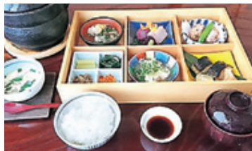
※写真はすべてイメージです。